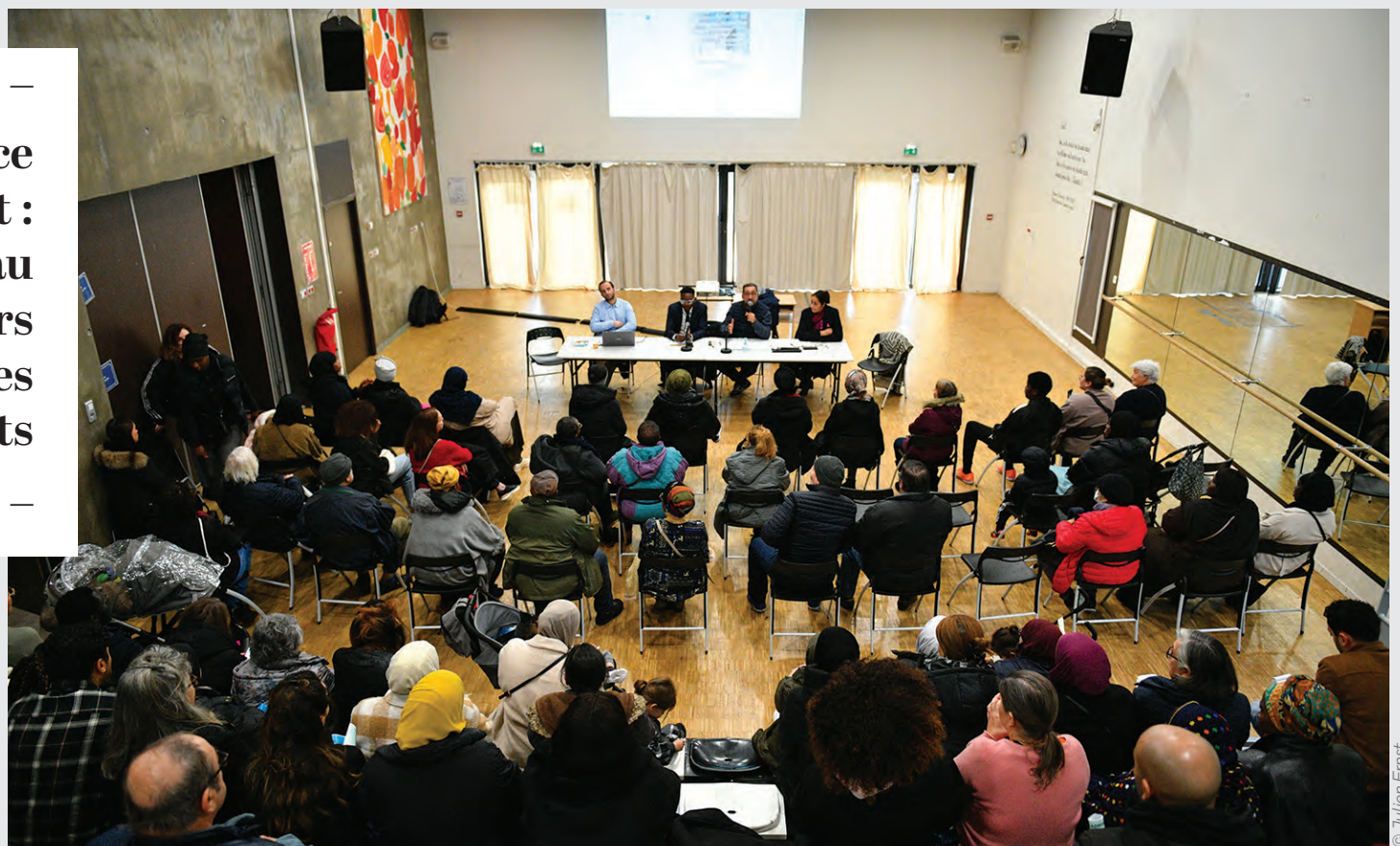
L'un des moments phares du Mois du logement était cette conférence

Depuis 2019, les locataires peuvent proposer leurs logements à échanger sur la plateforme Échanger Habiter.