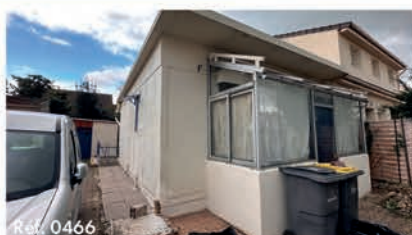
Réf. 0466 Maison 35 m 2 - 3 pièces - Garges-lès-Gonesse 195 000 €