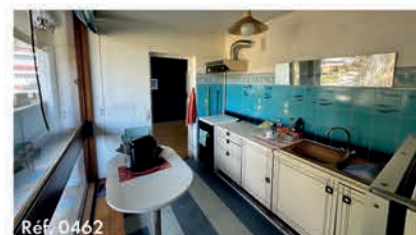
Réf. 0462 Appartement 57.45 m 2 - 3 pièces - Stains 140 000 €

Contactez Mme Laetitia COMBAL par téléphone au 01 48 26 14 14 ou par email : agence@immostains.fr