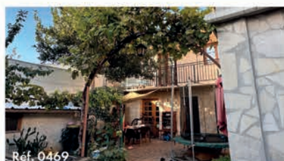
Réf. 0469 Maison 111 m 2 - 5 pièces - Saint-Denis 349 000 €