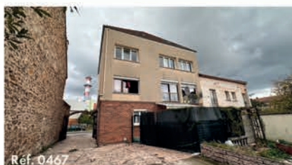
Réf. 0467 Appartement 47.22 m 2 - 2 pièces - Stains 160 000 €