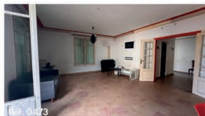
Ref. 0473 Maison 122.5 m 2 - 4 pièces - Stains 265 000 €