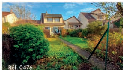
Ref. 0476 Maison 94 m 2 - 6 pièces - Stains 310 000 €