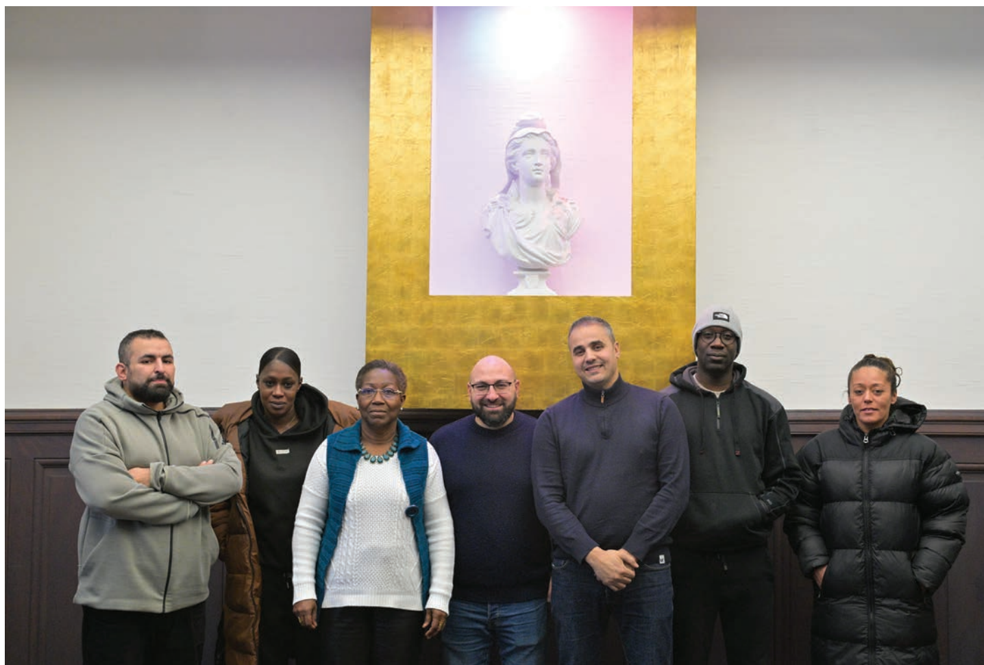
Voici les agents recenseurs qui se présenteront à votre domicile.