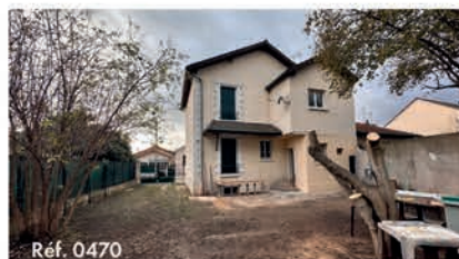
Ref. 0470 Maison 108 m 2 - 7 pièces - Stains 350 000 €