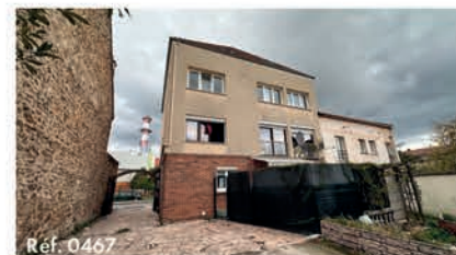
Ref. 0467 Appartement 47.22 m 2 - 2 pièces - Stains 160 000 €

Contactez Mme Laetitia COMBAL par téléphone au 01 48 26 14 14 ou par email : agence@immostains.fr