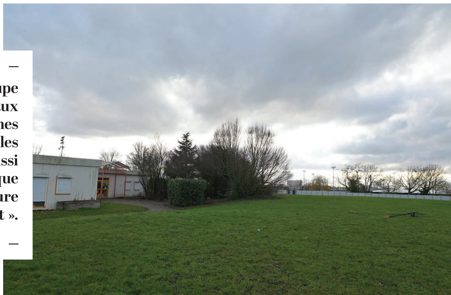
C'est sur cette partie de la Plaine Delaune que le futur groupe scolaire sera érigé.

14 millions d'euros (HT) de budget ont été affectés au budget en 2023