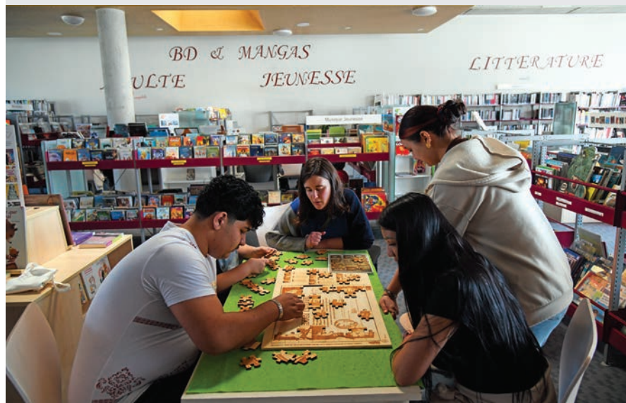
Les médiathèques ont organisé des jeux et ateliers sur l'égalité femmes-hommes.

Le Mois de l'égalité 2026 sera officiellement lancé samedi 7 mars avec un spectacle sur le handicap. Un autre spectacle, une conférence musicale et un débat sont prévus pour ce mois de sensibilisation aux discriminations.