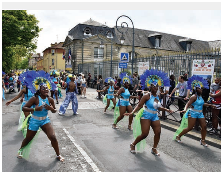
Le conseil a acté une convention avec Action créole qui organise entre autres le Carnaval Stains.