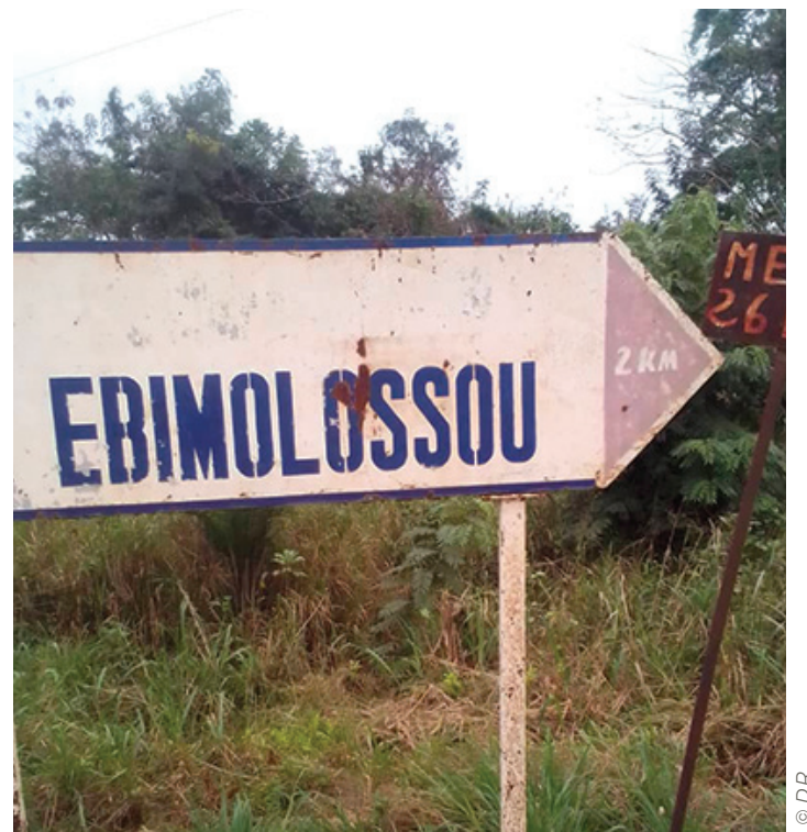
Les dons stanois seront acheminés à Ebimolossou, en Côte d'Ivoire.

Après plusieurs mois de préparation, l'association Jomag solidaires a été fondée. Son objectif, agir concrètement dans des villages d'Afrique, notamment en Côte d'Ivoire et au Sénégal, tout en offrant à ses membres des moments de convivialité en France, notamment à travers un « Club amical ». Mais aussi pour favoriser la solidarité et le partage pour un monde plus juste, encourager la générosité et l'ouverture vers le monde et promouvoir des comportements écoresponsables pour réduire le gaspillage.